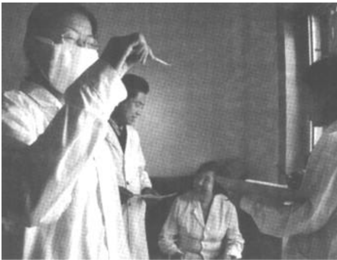
河口区孤岛镇在防治“非典”工作中，严把“流入流出”关，他们对辖区内流动人口进行认真的摸底调查、登记，坚决杜绝“非典”的蔓延。图为该镇分管领导、计生技术人员对流动人口进行现场测量体温和“非典”宣传教育。