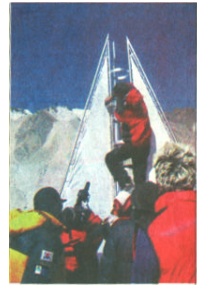
准备登山了，队员们纷纷签字留念

目前，在国内，能够组织7000米以上山峰攀登活动的机构几乎没有，只有中国登山协会、西藏登山协会具有这样的能力，要推广登山运动就要借助活动，但能担负攀登7000米以上山峰费