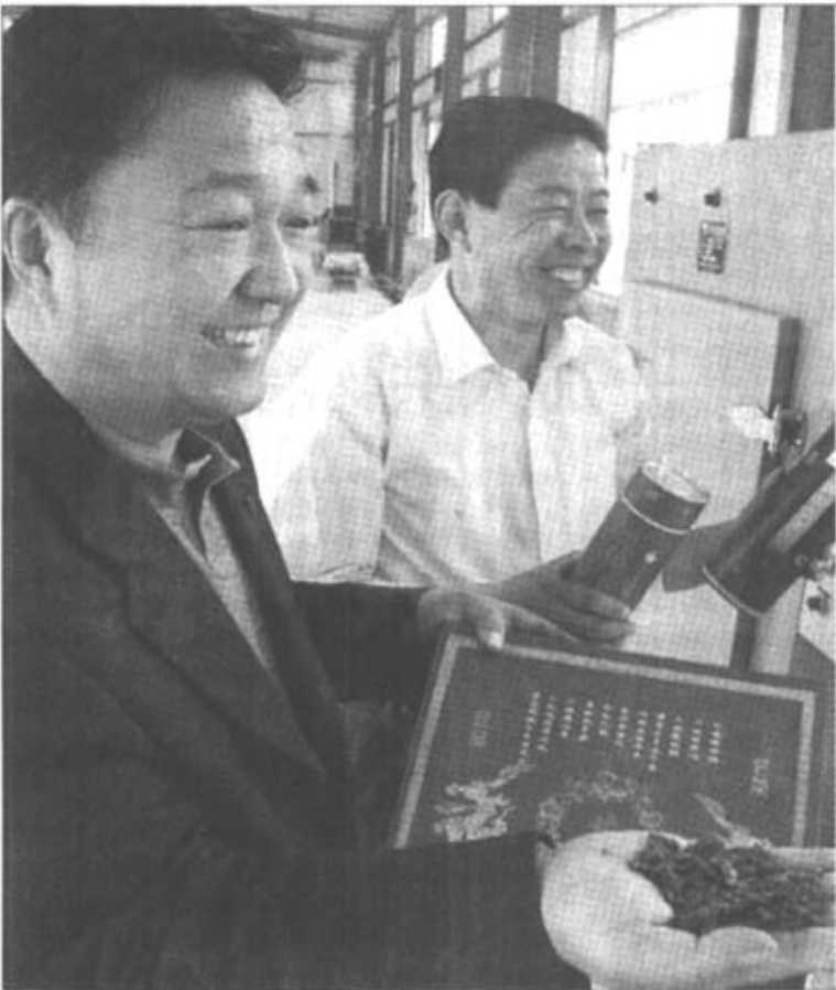
东营市康龙茶叶有限公司瞄准当今饮料最新前沿，与高等院校合作，以利津县北宋镇万亩芦笋高科技园中的新鲜芦笋为原料，采用高温杀青、提香等先进工序，开发出笋峰等四种富含多种维生素和氨基酸的保健芦笋茶。目前，产品已陆续投放市场，供不应求，市场前景广阔。